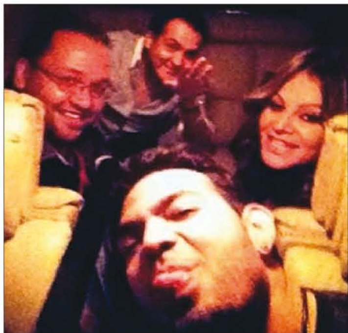
LA ÚLTIMA. Esta es la fotografía que subió a las redes sociales el maquillista de la artista momentos antes de haber iniciado el trágico vuelo.