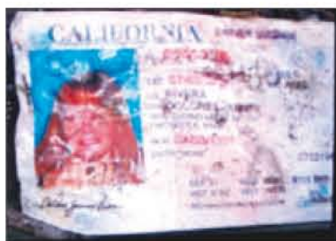
LA LICENCIA. Hallan el documento entre los escombros.

■ Hallan restos de su avión en sierra de Nuevo León; dicen que se desplomó ■ Se dirigía al aeropuerto de Toluca, luego de ofrecer concierto en Monterrey .32