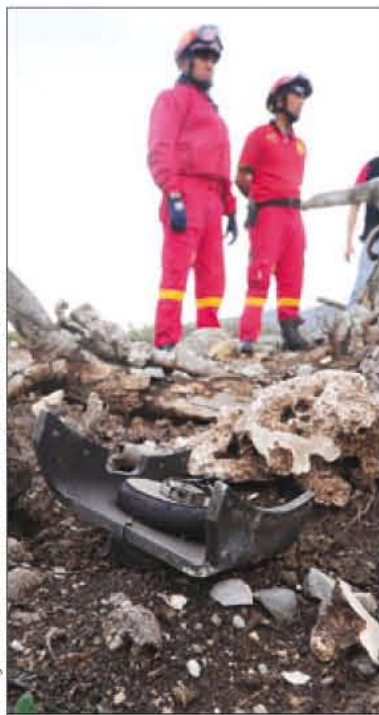
LOS RESTOS. Horas después del accidente localizan los restos del aparato.